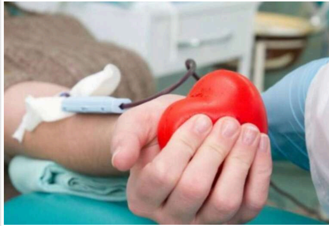
Після атаки РФ на Суми місто терміново потребує донорів крові

Після чергового ворожого удару по Сумах, внаслідок якого є постраждалі, місцеві лікарні терміново звертаються до мешканців з проханням здати кров.