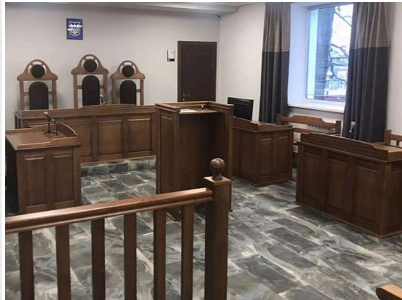
В Яготині на Київщині відбувається суд над жінкою, яка скинула собаку з мосту

На Київщині почався суд над жінкою, яка скинула свого маленького песика з висоти майже 10 метрів, просто із залізничного мосту. Ця історія сколихнула українців своєю жорстокістю влітку 2024 року.