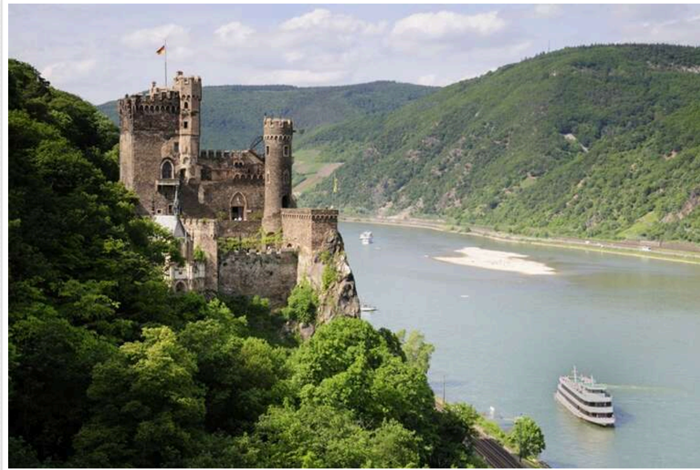
У Німеччині падає рівень води в річках і озерах: "Рейн міліє на очах"

У Німеччині фіксується рекордне зниження рівня води в річках і озерах, повідомляє DW. Це стосується і головної річки країни.