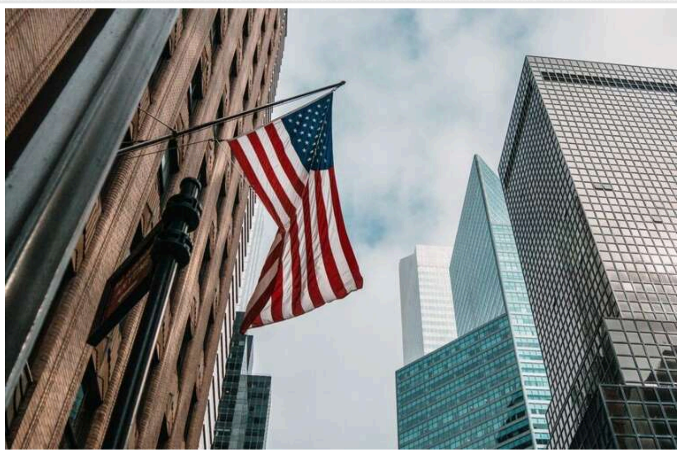
Reuters: Позиція Віткоффа викликала занепокоєння в США й серед союзників

Після зустрічі з переговорником російського диктатора Володимира Путіна Кирилом Дмитрієвим у Вашингтоні спецпредставник президента США Дональда Трампа Стів Віткофф передав американському президенту повідомлення від Кремля. Він заявив, що найшвидшим шляхом досягнення припинення вогню в Україні було б визнання США суверенітету Росії над захопленими нею українськими регіонами.