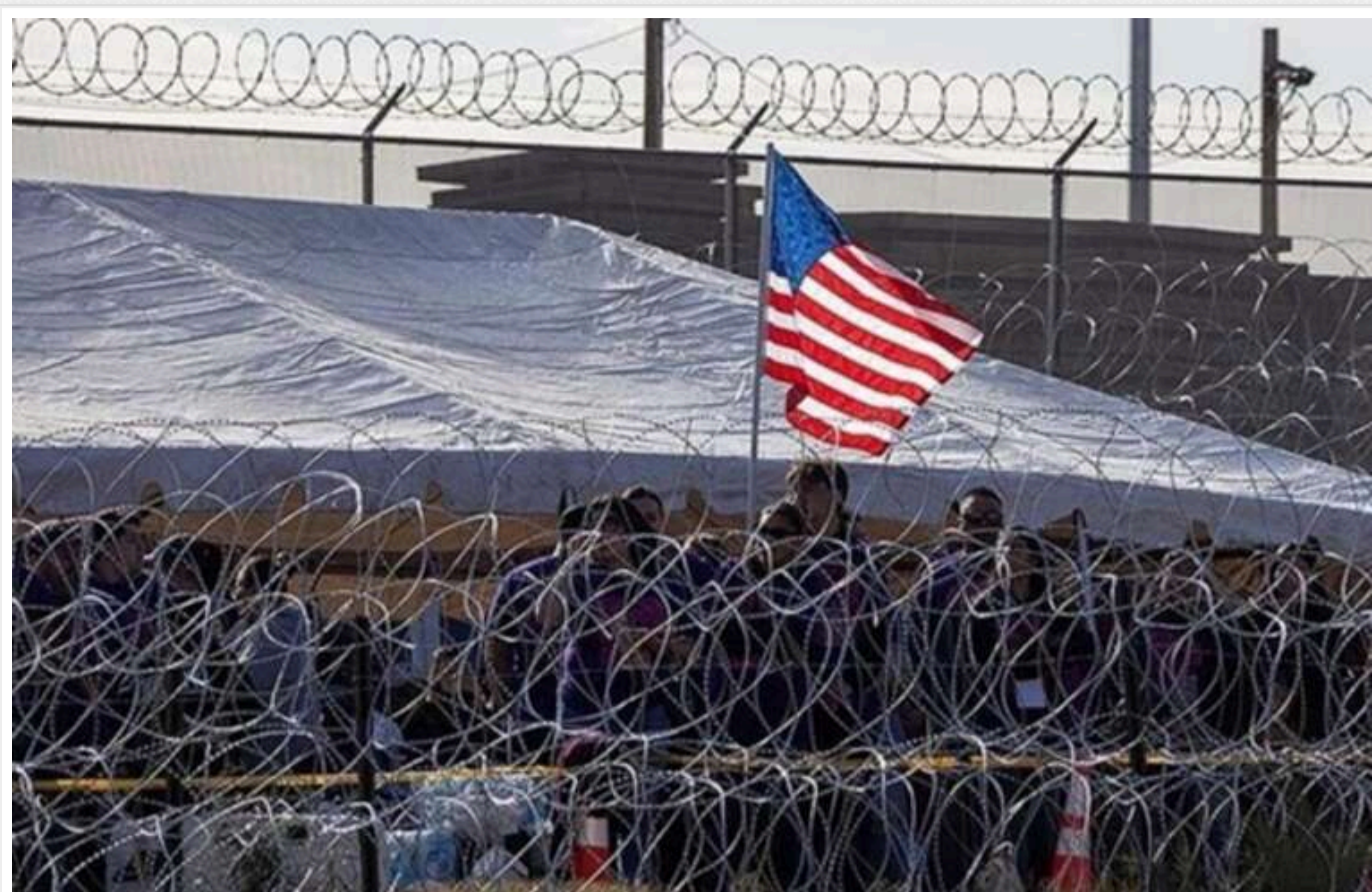
WP: Адміністрація Трампа планує депортувати мільйон мігрантів за рік

Адміністрація президента США Дональда Трампа готує план наймасштабнішої депортації в історії країни. Однак юридичні та фінансові перепони можуть завадити цим амбітним планам.