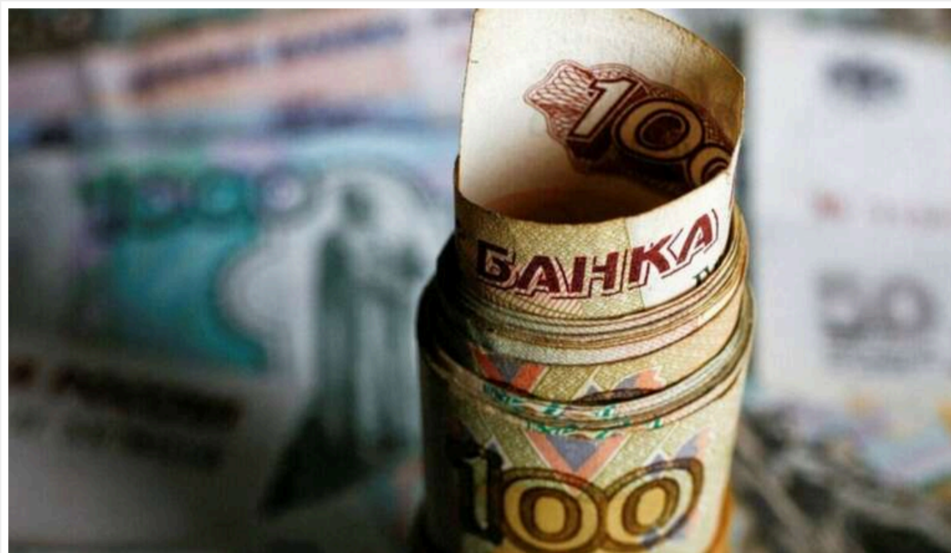
Британська розвідка: Інфляція може посилити тиск на здатність РФ підтримувати високі витрати на оборону

Через тривалий інфляційний тиск Росії, ймовірно, не вдасться зберегти високі оборонні витрати в майбутньому.