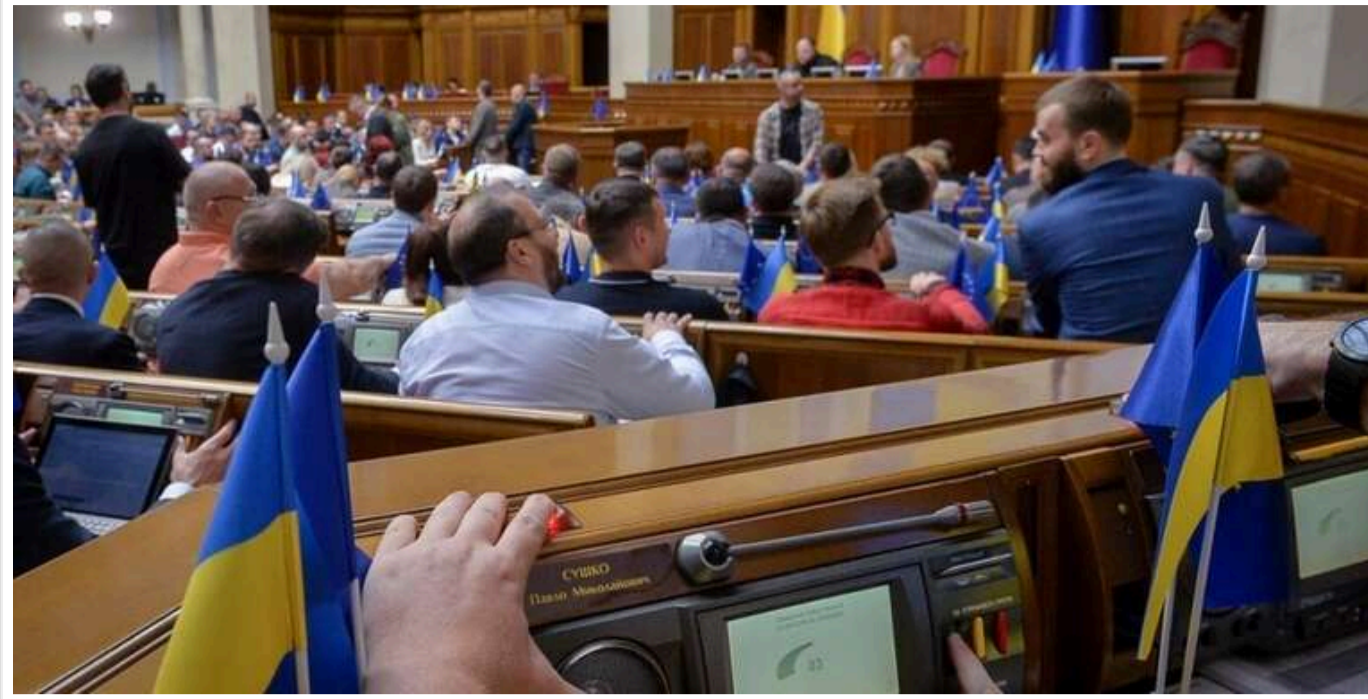
«Слуга народу» ініціює законопроект про обмеження каденцій мерів: під загрозою Кличко, Садовий, Труханов і Філатов

Фракція "Слуга народу" розробляє новий законопроект, який позбавить Віталія Кличка можливості залишатися мером Києва, Геннадія Труханова – мером Одеси, Бориса Філатова – мером Дніпра, а Андрія Садового – мером Львова.