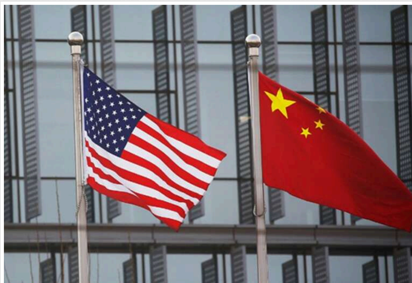
Адміністрація Трампа намагалася попередити Китай про тарифи, але безуспішно, – CNN

У своїй особистій дипломатії адміністрація Дональда Трампа не раз намагалася попередити Китай про можливі наслідки запровадження відповідних тарифів.