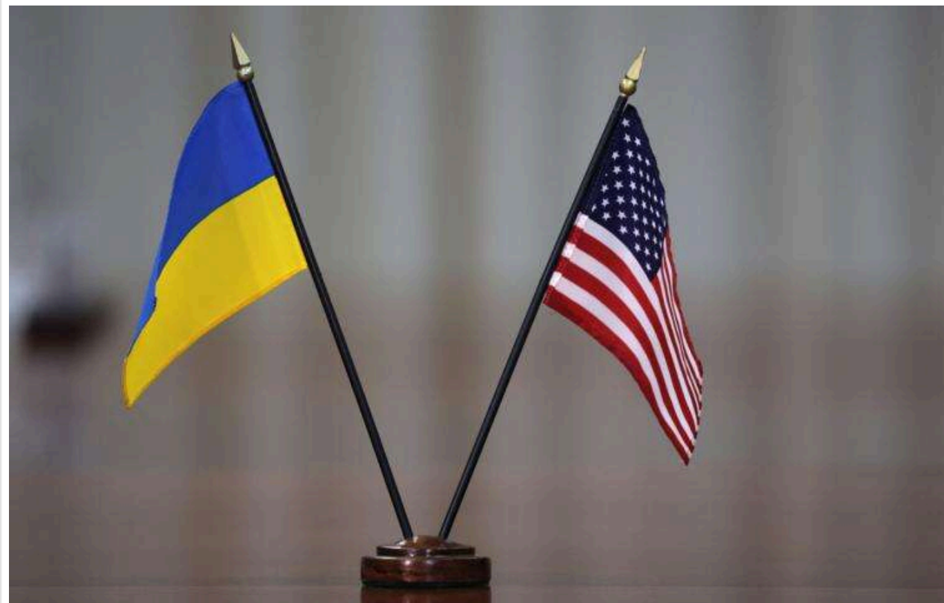
Напруга на україно-американських переговорах щодо надр: джерела говорять про «антагоністичну атмосферу»

Переговори між Україною та США щодо потенційної угоди у сфері надрокористування, які стартували сьогодні у Вашингтоні, проходять у напруженій атмосфері.