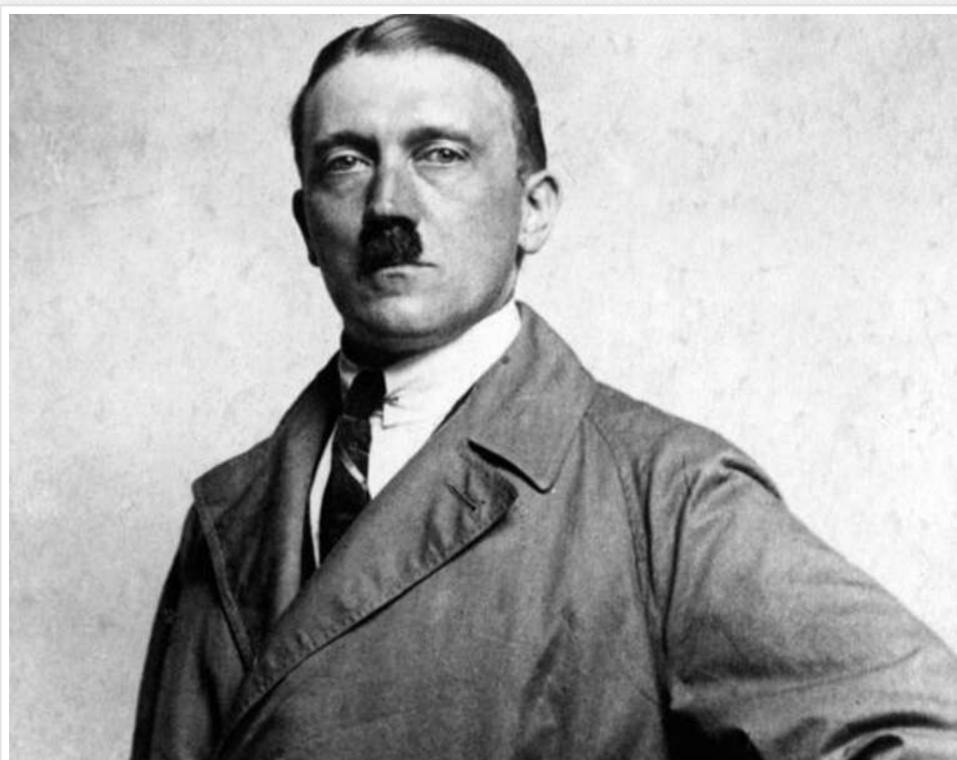
ЦРУ шукало Гітлера ще 10 років після війни, – NYP

Американське Центральне розвідувальне управління (ЦРУ) продовжувало шукати Адольфа Гітлера впродовж десяти років після завершення Другої світової війни.