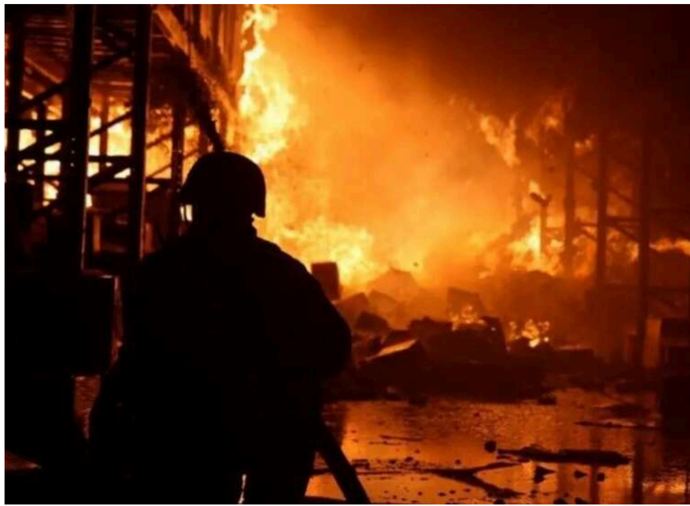
Атака "шахедів" по аеропорту Дніпра 4 квітня: знищено чотири пасажирські літаки та бізнес-джет

Унаслідок нічної атаки дронами-камікадзе "Шахед" по аеропорту Дніпра 4 квітня було знищено ангар із чотирма пасажирськими літаками та одним бізнес-джетом.