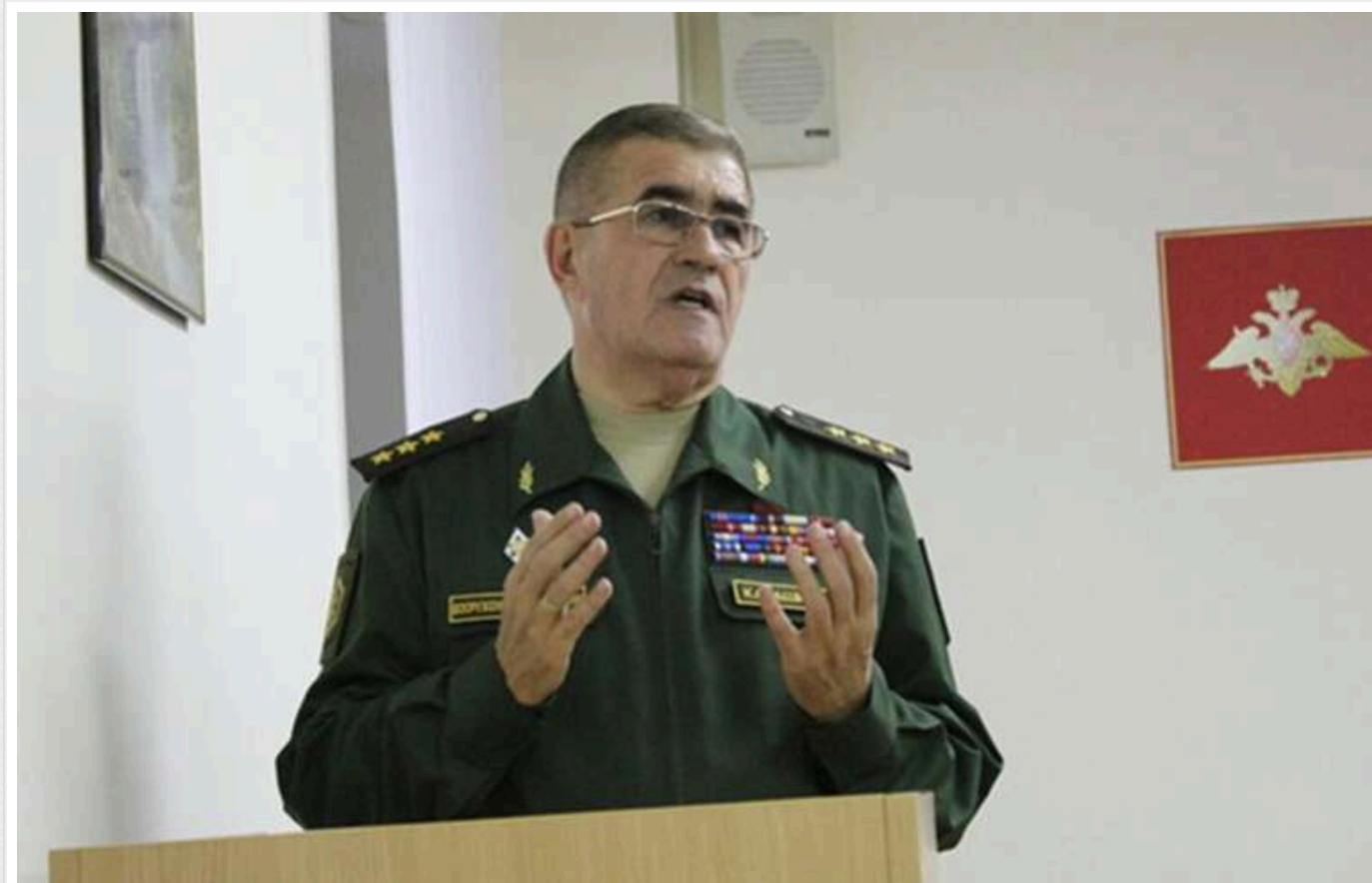
Вартість активів – майже мільярд гривень: АРМА шукає управителів арештованого майна генерала Капашина у Полтаві

Генерал-полковник армії РФ Валерій Капашин володів в обласному центрі готельно-ресторанним комплексом, офісними приміщеннями, земельними ділянками та квартирою.