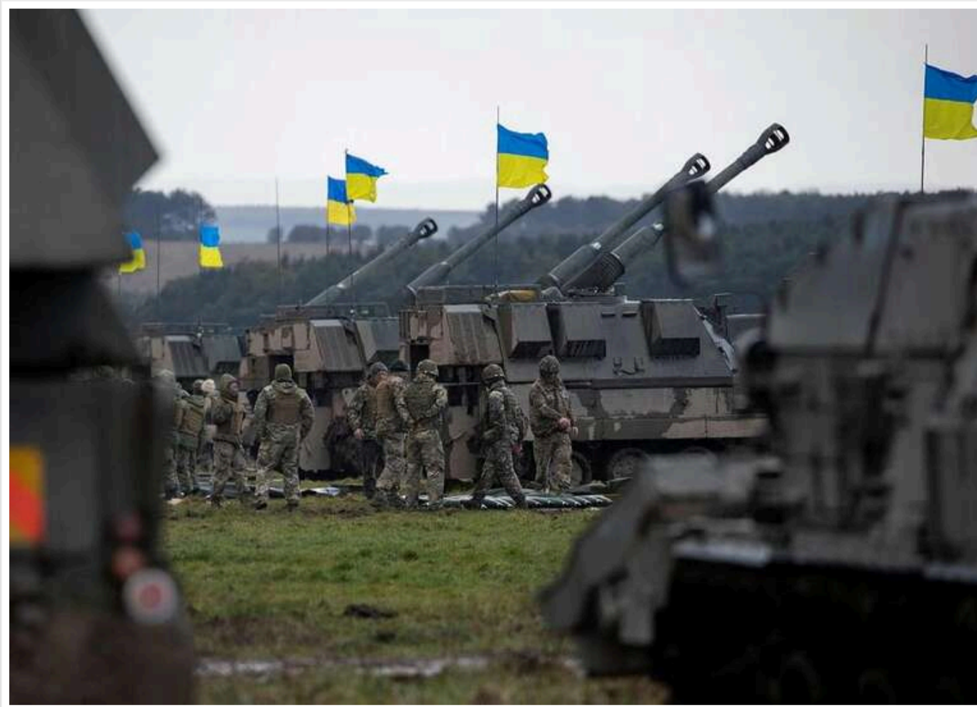
ЗСУ зірвали плани РФ щодо Покровська: на Лиманському напрямку окупанти "переломили" українську оборону

Пріоритетними напрямками для російських окупантів залишаються агломерації міст на Донеччині — це Покровськ-Мирноград та Краматорськ-Слов'янськ-Костянтинівка.