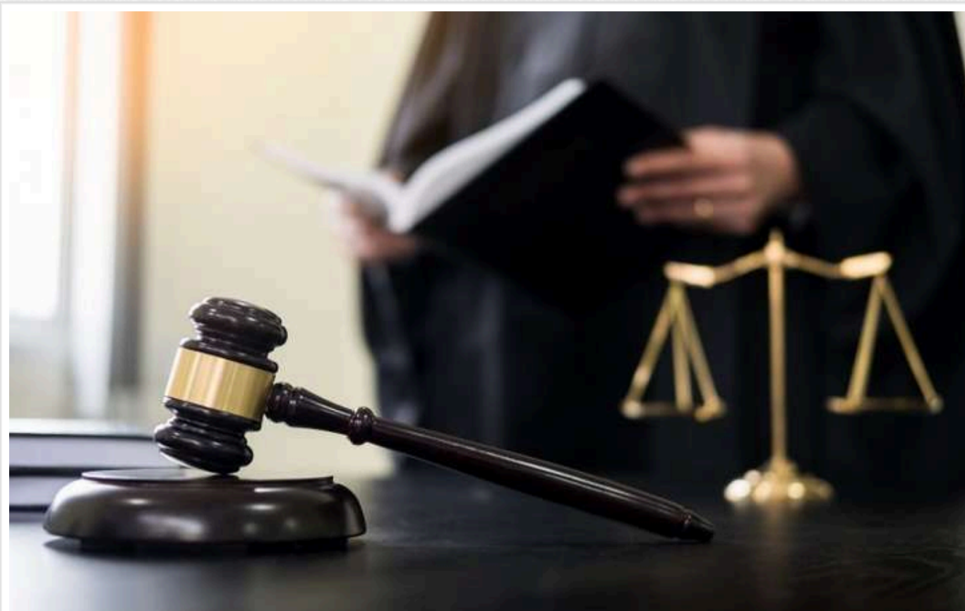
Отримали 10 років, але не видали замовника: Азербайджанці тиждень катували пирятинського фермера

Трьох громадян Республіки Азербайджан, яких обвинувачували у викраденні підприємця в Пирятині, його незаконному утриманні та в підготовці до умисного вбивства, засуджено до 10 років ув'язнення з конфіскацією майна. Викрадення бізнесмена відбулося наприкінці грудня 2021 року, а на початку січня азербайджанців було затримано. Вони не визнали своєї провини, але колегія суддів Ожтябрьського райсуду Полтави дійшла висновку, що обвинувачення довело їх причетність до злочинів.