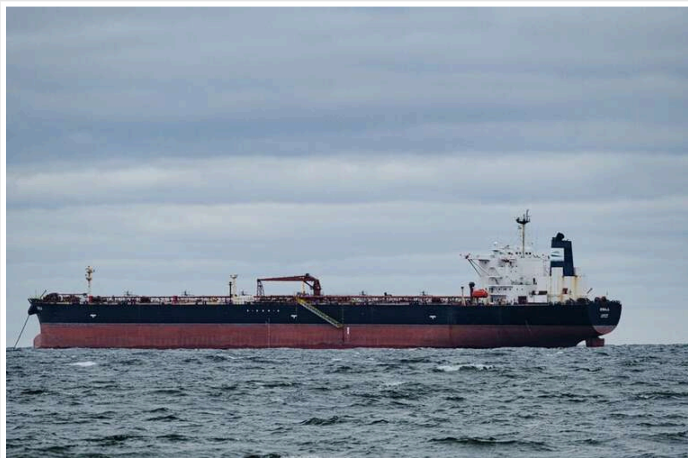
Сили оборони Естонії затримали танкер тіньового флоту Росії

У п'ятницю вранці, 11 квітня, Естонія затримала нафтовий танкер Kivana – це судно належить до російського "тіньового флоту", що займається експортом російської сирової нафти та нафтопродуктів у треті країни.