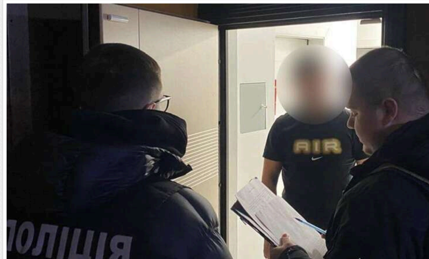
У Києві ліквідували черговий нелегальний канал переправлення ухиянтів до ЄС: до 15 000 доларів з особи

53-річний мешканець Києва організував механізм незаконного перетину кордону для чоловіків призовного віку, залучивши до його реалізації трьох жителів Київської області.