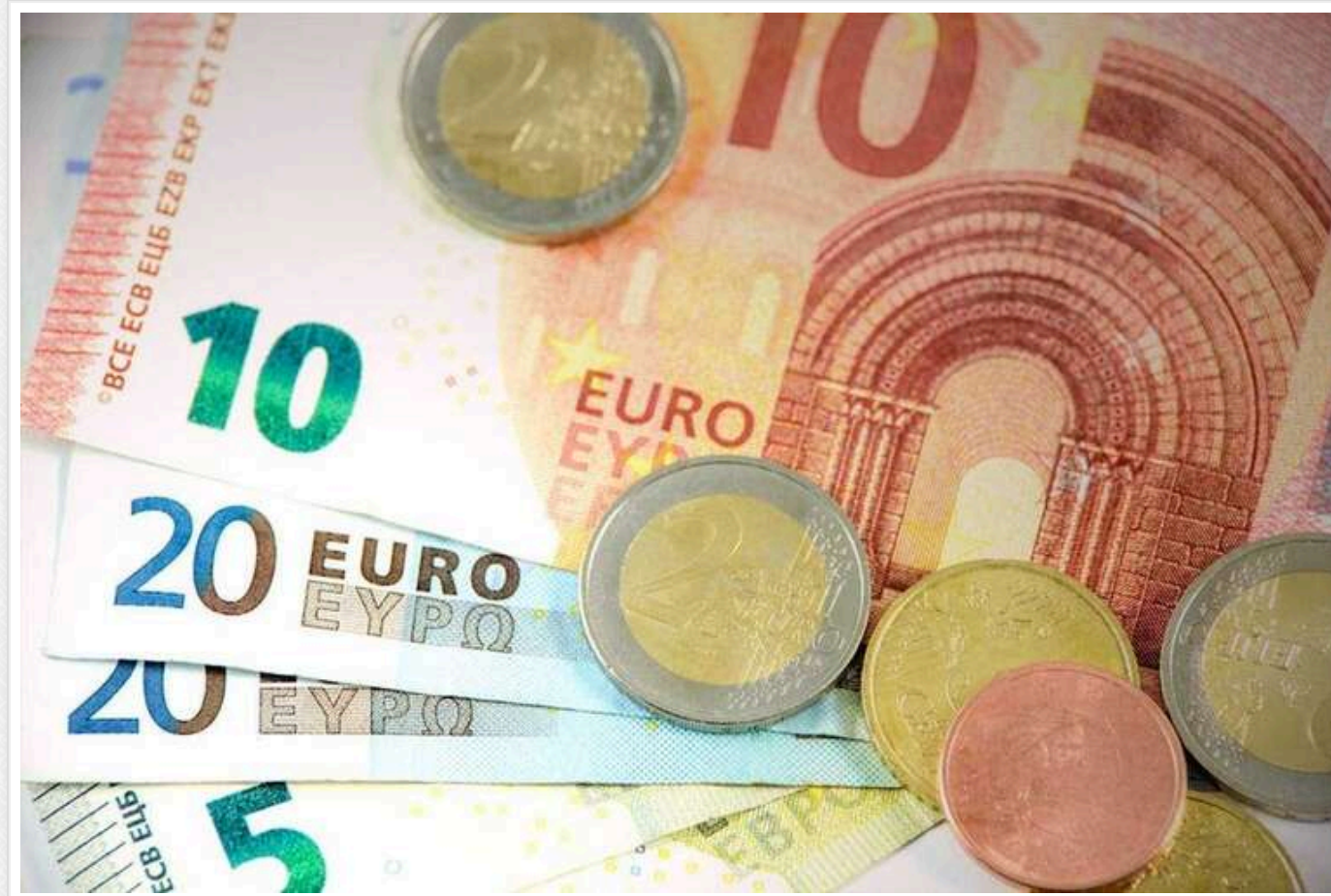
Офіційний євро суттєво зріс та оновив історичний рекорд

НБУ оновив офіційний курс євро на 14 квітня до 46,92 грн, що одразу на 1,07 грн більше за поточний курс, який діятиме на вихідних. А також це є рекордом в історії України.