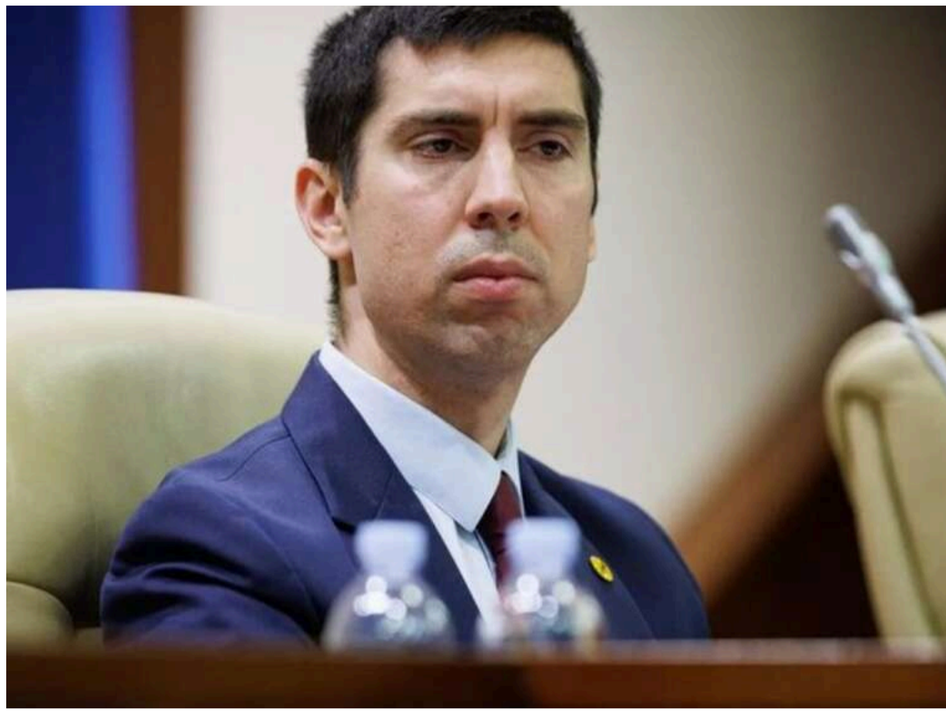
Міністр закордонних справ Молдови пояснив, чому посла РФ не висилають з країни