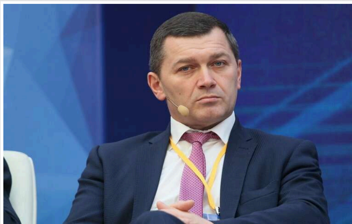
Ткаченко звільнив Поворозника з посади першого заступника голови КМВА

Голова Київської міської військової адміністрації Тимур Ткаченко звільнив Миколу Поворозника з посади першого заступника очільника КМВА. Однак Поворозник залишається заступником міського голови Віталія Кличка.