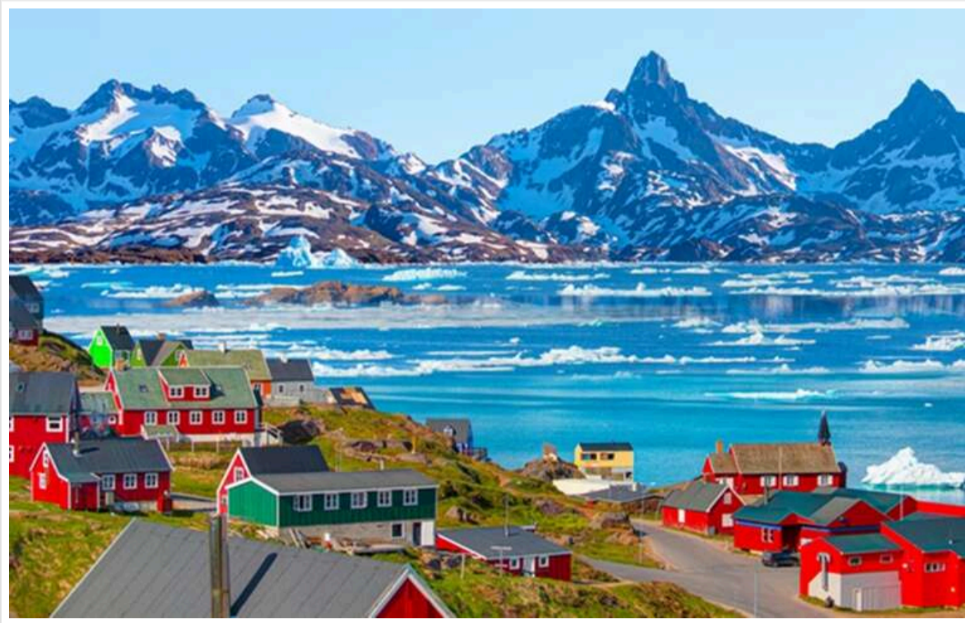
Техноінвестори з Кременівеї долини пропонують Трампу створити з Гренландії «місто свободи», - Reuters

Інвестори з технологічного сектора Кременівеї долини пропонують Трампу перетворити Гренландію на «місто свободи» - "лібертаріанську утопію з мінімальним корпоративним регулюванням", повідомляє Reuters, посилаючись на свої джерела.