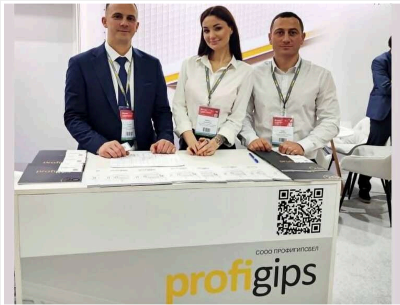
Подвійна гра ProfiGips: як польська компанія опинилася в епіцентрі скандалу

Відомий польський виробник будівельних матеріалів ProfiGips опинився під шквалом критики, причиною якої стала подвійна політика компанії. Адже попри понад трирічну повномасштабну війну Росії проти України, бренд так і не вийшов з ринку РФ, при цьому активно просуваючи свою продукцію і на українському ринку.