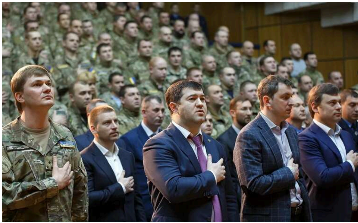
Мобілізацію ексголови ДФС Насірова скасували: в ЗСУ розпочато розслідування

У Збройних силах України скасували наказ про мобілізацію ексголови Державної фіскальної служби Романа Насірова, якого підозрюють у хабарництва. Було розпочато службове розслідування щодо законності його призову.