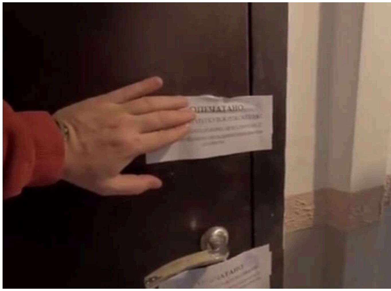
Окупанти в Маріуполі планують конфіскувати квартири "без власників"

В окупованому Маріуполі ситуація з квартирами, власники яких знаходяться в Україні або Європі, стає все більш напруженою.