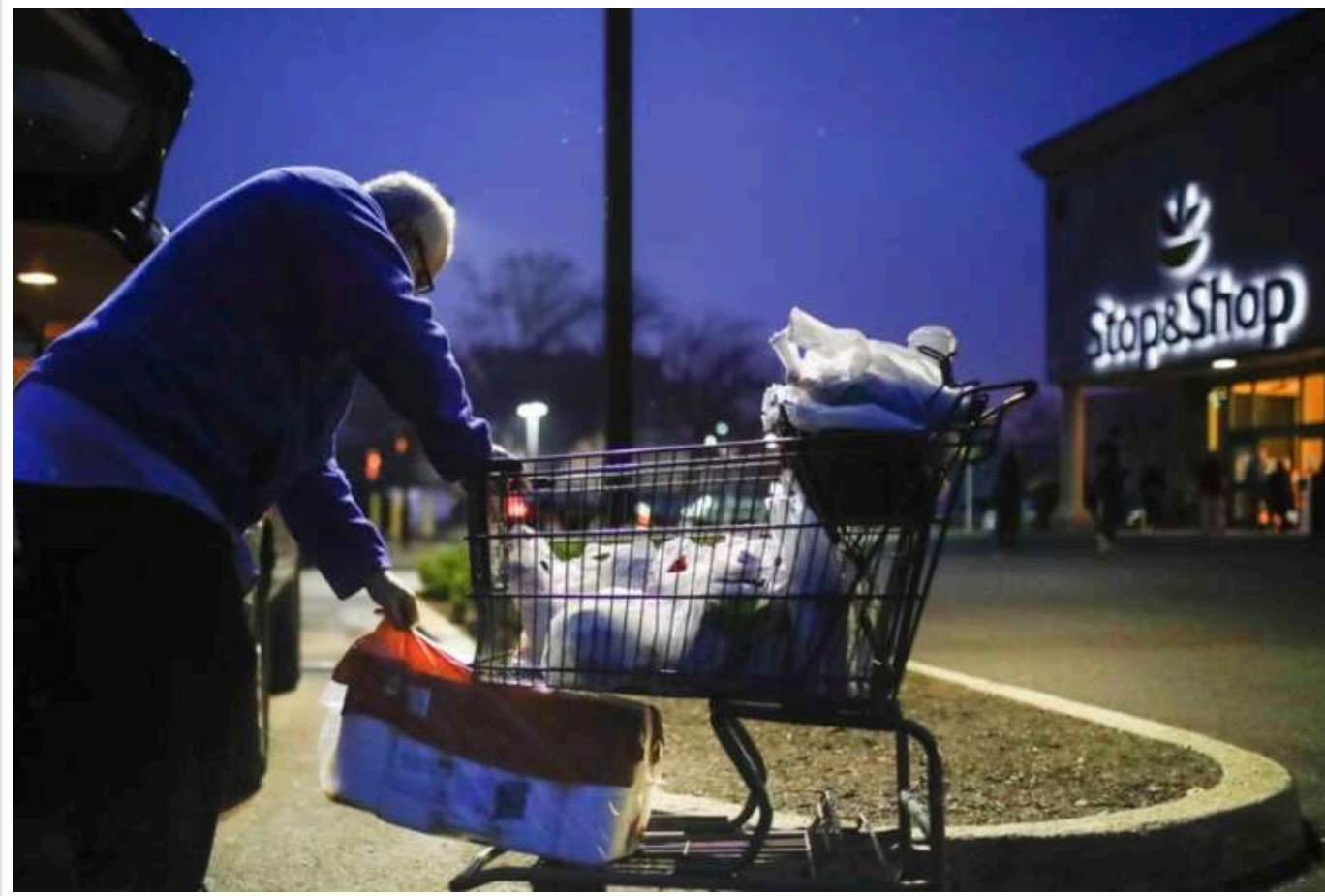
Жителі США почали активно скуповувати товари найпершої потреби через тарифи, запроваджені Трампом, - ЗМІ

Американці почали активно закуповувати товари найпершої потреби, побоюючись підвищення цін і дефіциту на тлі введення нових мит на імпортовані товари.