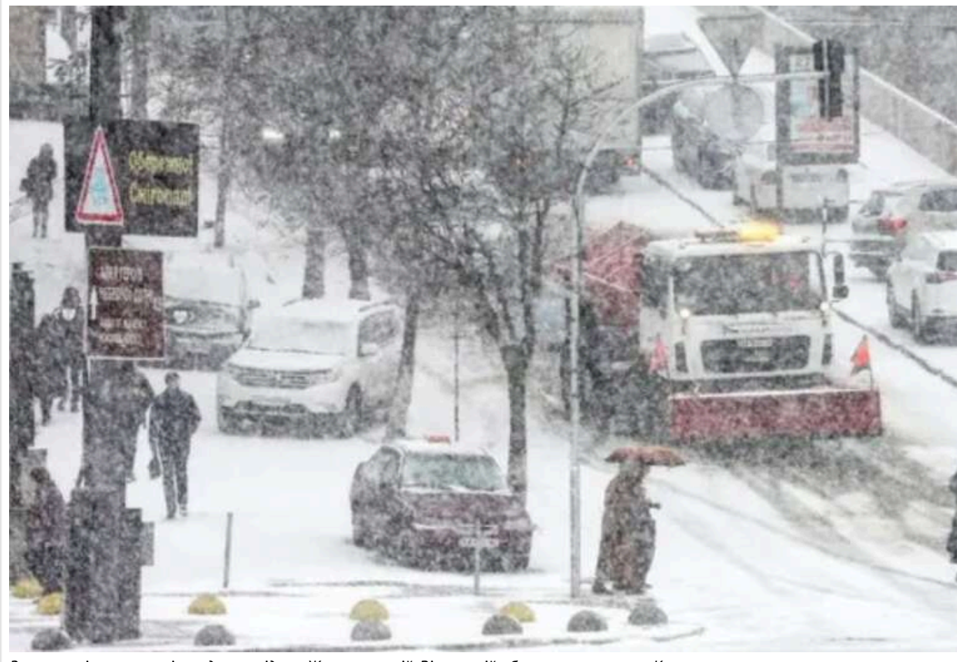
Завтра очікуються снігопади в західних, Житомирській, Вінницькій областях, а також в Карпатах

10 квітня в Україні очікується погіршення погодних умов, що може суттєво вплинути на функціонування транспорту та енергетичних систем.