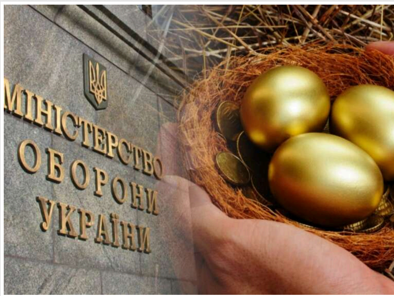
"Яйця по 17 гривень": першому фігуранту справи про розкрадання 733 мільйонів гривень обрали запобіжний захід

ВАКС ухвалив запобіжний захід для Валерія Мелеша – колишнього керівника ТОВ «Актив компанії» у справі щодо розкрадання 733 мільйонів гривень під час закупівлі продуктів для ЗСУ.