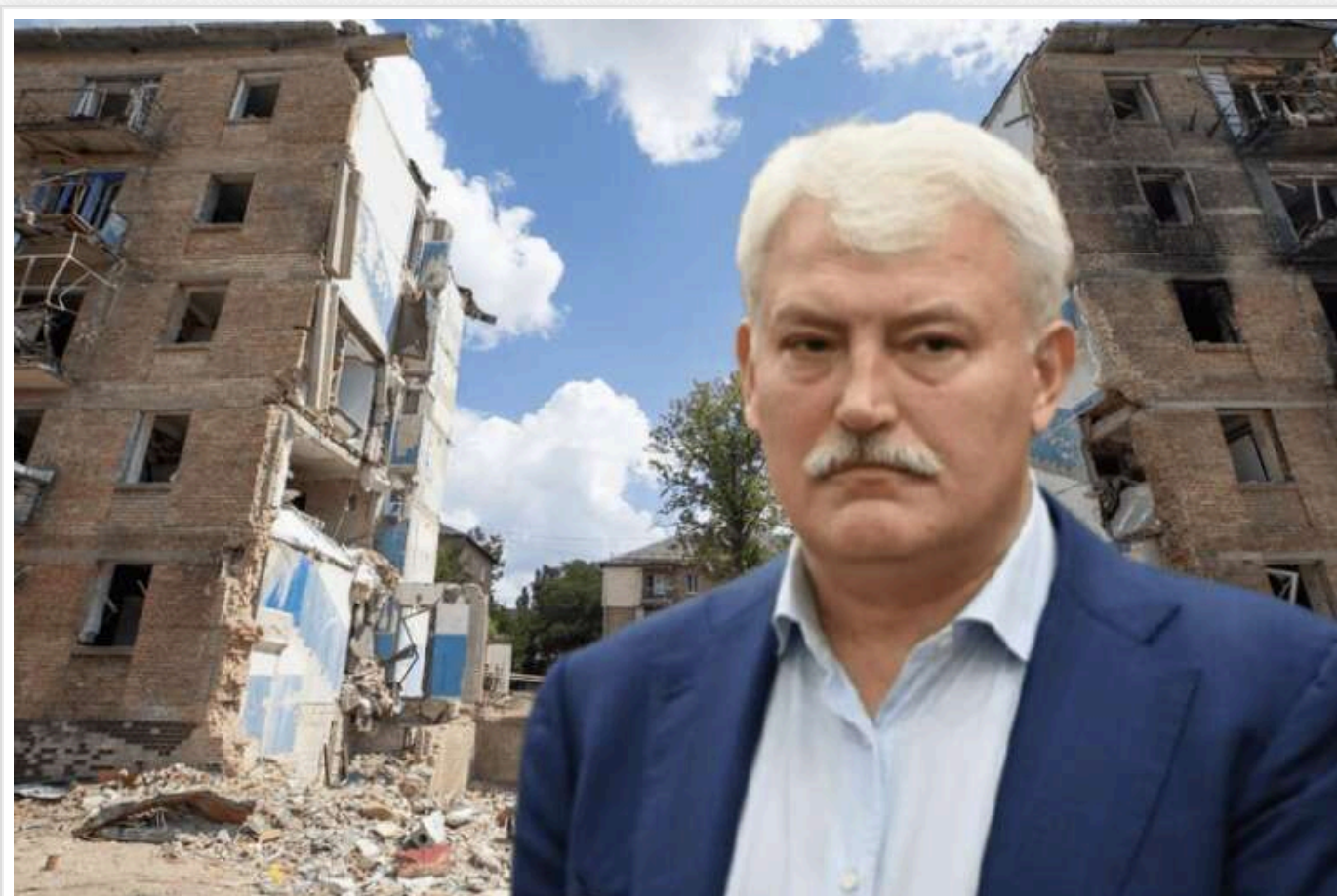
Без конкурсу і з минулим у кримінальних провадженнях: скандальна компанія “Прайд” відновлюватиме будинок на Сальського, де загинули 13 осіб

КП “Житлоінвестбуд-УКБ” без проведення конкурсу обрало підрядника для відновлення зруйнованого внаслідок російського ракетного удару будинку на вулиці Сальського, 19, під завалами якого загинуло 13 осіб. Вицілілі мешканці довгий час домагалися хоча б тимчасового притулку від міської влади, а зараз отримали надію на повернення до свого житла: згідно з умовами підписаного договору, багатоповерхівка повинна бути не лише побудована до кінця року, а й утеплена та забезпечена всіма необхідними комунікаціями. Виконавцем стала компанія “Прайд”, яка свого часу була зареєстрована в вигаданому одесі під Києвом. Наразі ця фірма активно залучена до відновлення пошкоджених будівель Києва, в тому числі працюючи як субпідрядник “Житлоінвестбуд-УКБ” через компанію, що також фігурує разом з нею в кримінальних провадженнях щодо розрати бюджету.