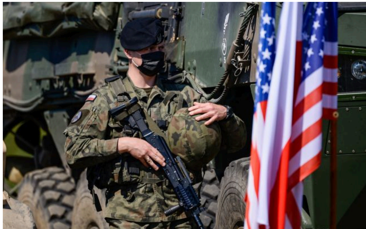
Фото: у США заявили про готовність повторити атаки (Getty Images)