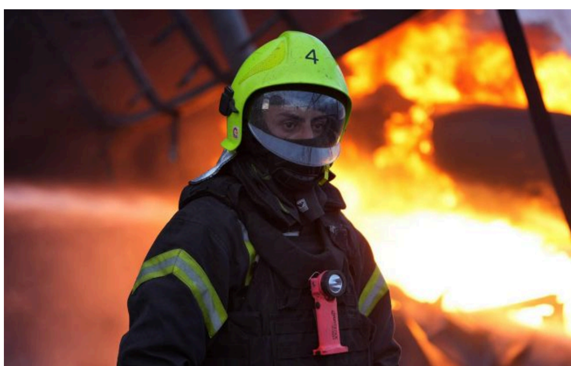
Фото: окупанти вчоргове здійснили дронуву атаку