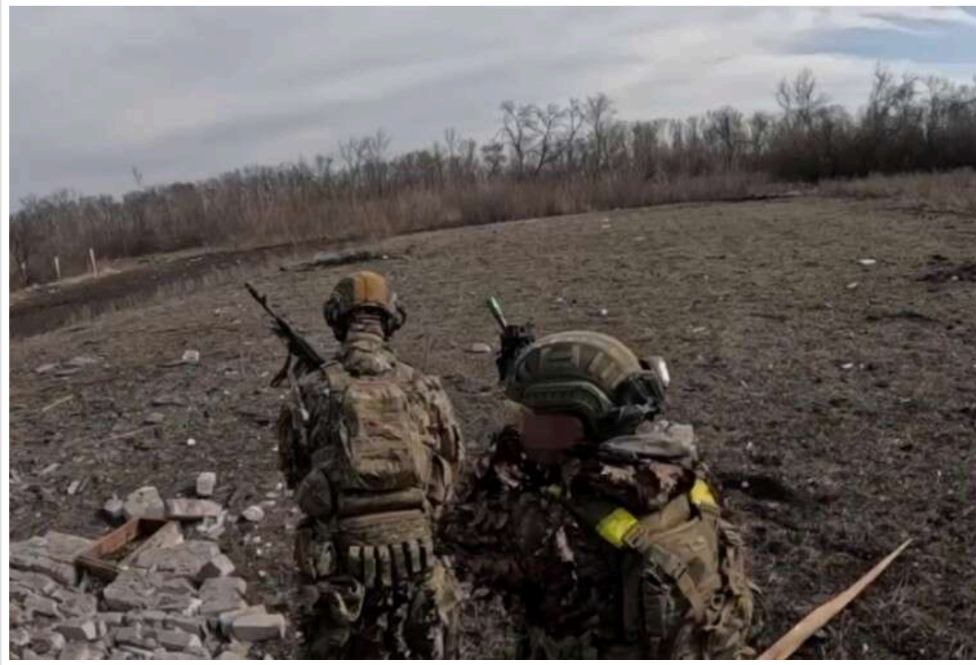
На Лиманському фронті склалася критична ситуація. Необхідно терміново ухвалити управлінські та організаційні рішення

Критична ситуація на Лиманському фронті потребує негайних управлінських та організаційних рішень. Інакше обвалиться фронт на Осколі.