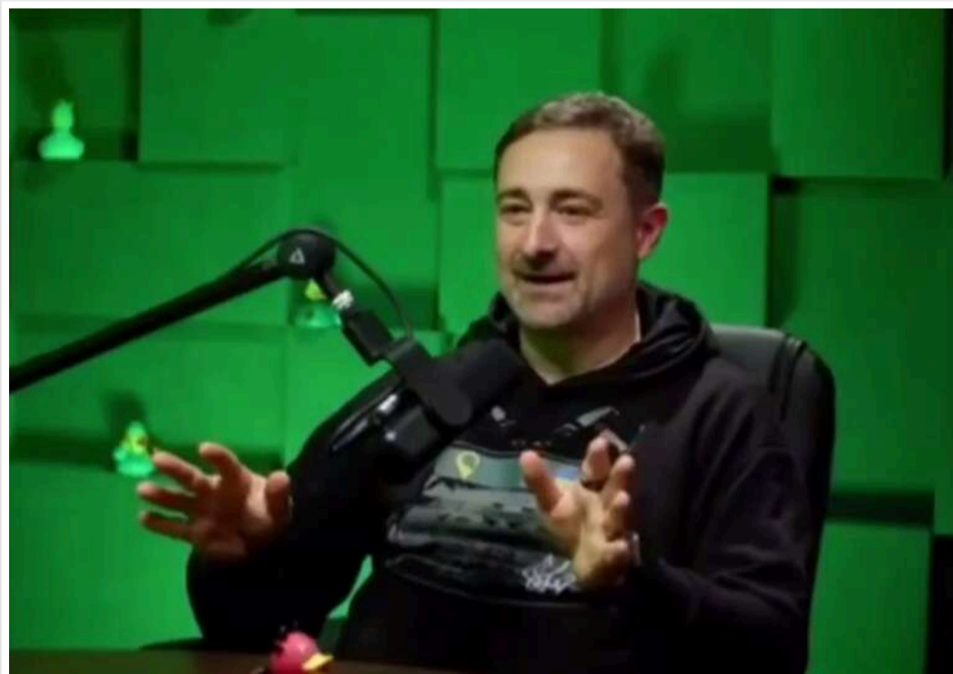
«Укрпошта» “озброїла” листонош курячими ніжками для захисту від собак

Генеральний директор “Укрпошти” Ігор Смілянський повідомив про незвичний спосіб захисту листонош від агресивних собак.