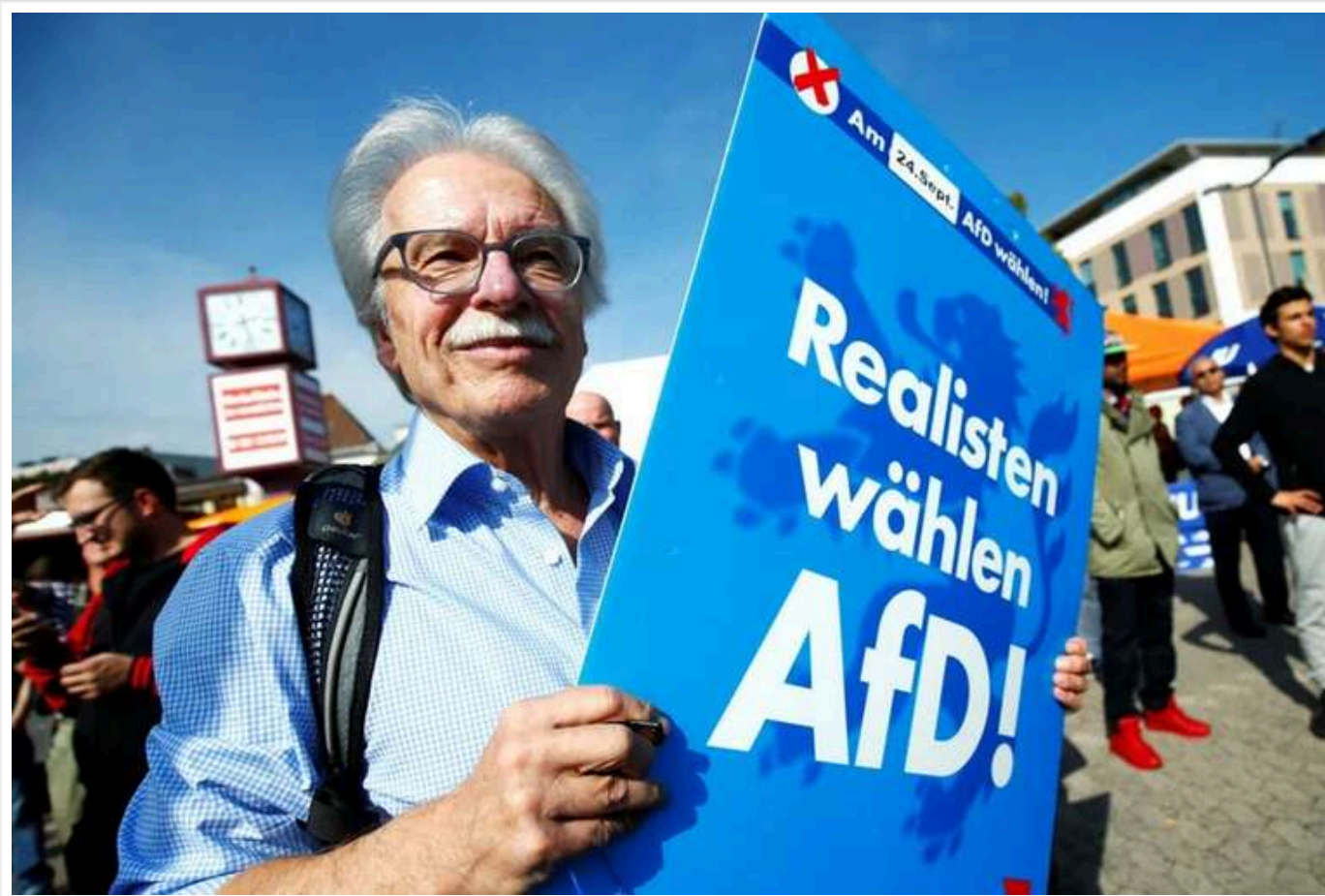
"АдН" вийшла на перше місце в опитуваннях, - Reuters

За даними агентства Reuters, партія «Альтернатива для Німеччини» посіла першу позицію в рейтингах.