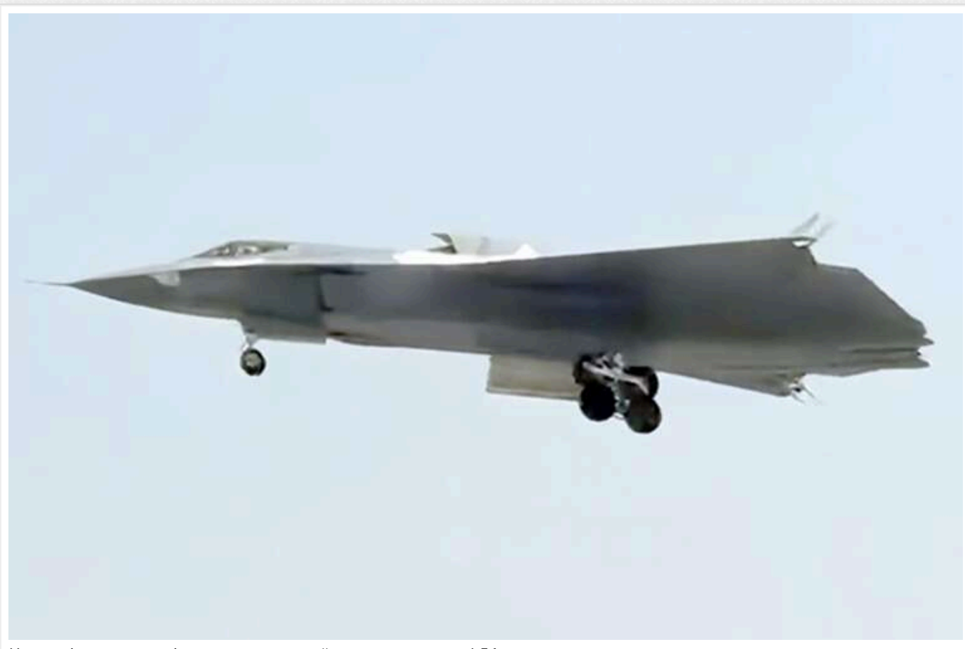
У мережі показали політ секретного китайського винищувача J-36

У китайських соцмережах з'явилися нові зображення футуристичного бойового літака без хвоста й з трьома двигунами, який західні аналітики вже називають J-36. Відео, з якого було знято зображення, ймовірно, зняте поблизу злітно-посадкової смуги заводу Chengdu Aircraft Industry Group у провінції Сичуань — саме там, за припущеннями, й виготовили новий літак.