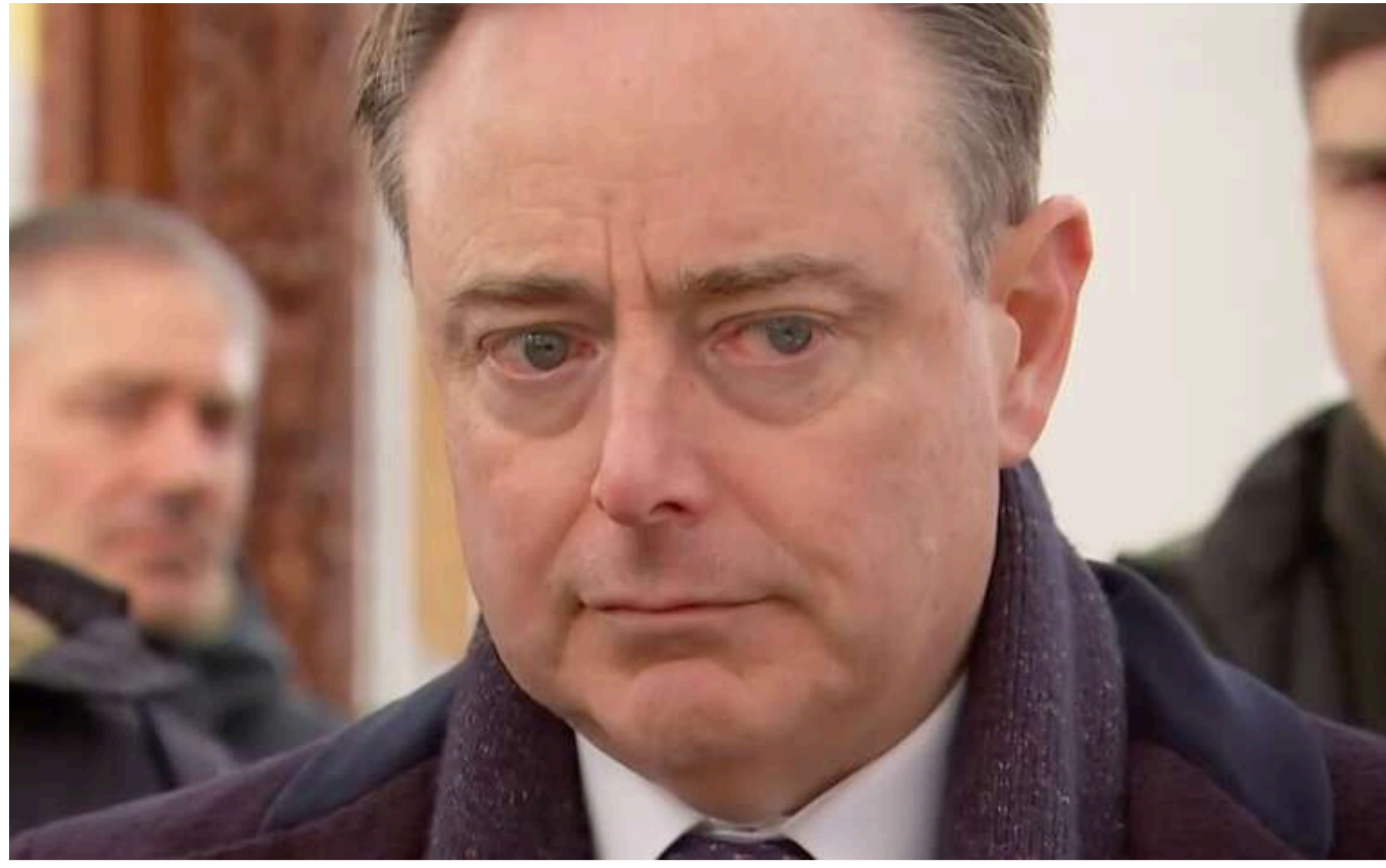
Прем'єр Бельгії у Бучі не стримав сліз після перегляду світлин звірств російських окупантів

Прем'єр-міністр Бельгії Барт Де Вевер під час візиту делегації до Бучі не зміг стримати почуттів після перегляду світлин жакіть, що вчинили російські війська під час окупації міста.