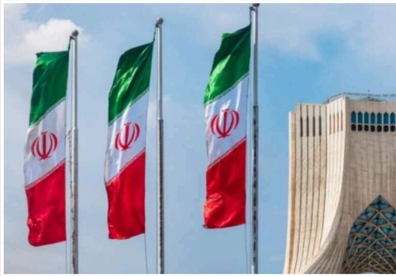
В Ірані уточнили заяву Трампа - перемовини будуть непрямими

Міністр закордонних справ Ірану Аббас Арагчі підтвердив, що незабаром відбудуться переговори зі Сполученими Штатами, проте вони не будуть прямими, як заявляв президент США Дональд Трамп.