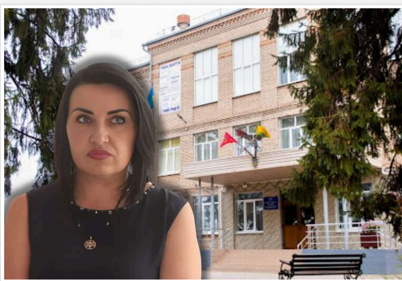
У Запоріжжі укрита для ліцею побудують за 114 мільйонів гривень, із переплатою на понад 6 мільйонів

ДП «Місцеві дороги Запорізької області» 27 березня за результатами тендеру замовило ТОВ «Еско Запоріжжя» будівництво укриття ліцею за 114,72 млн грн.