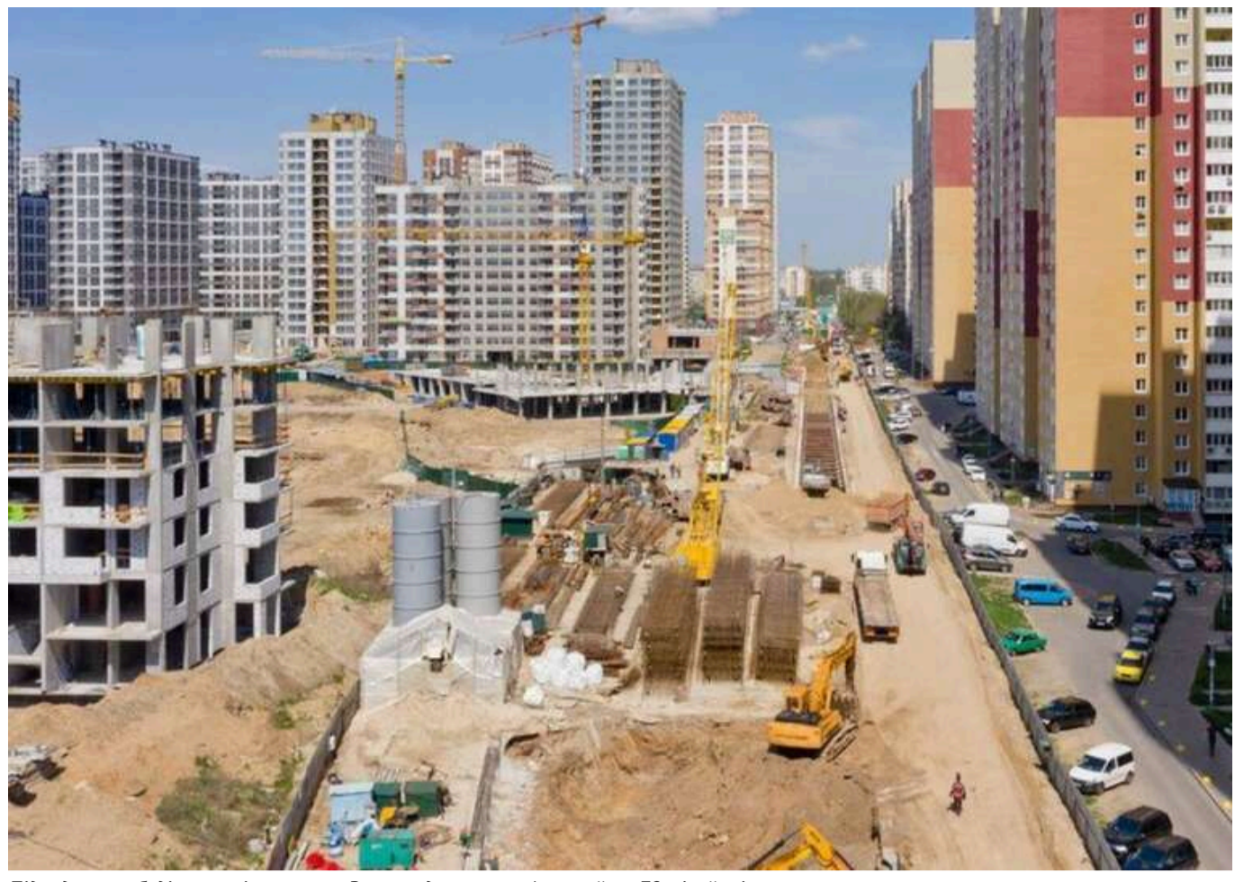
Підрядник на будівництві метро на Виноградар оштрафований на 78 мільйонів гривень

Йдеться про АТ «Київметробуд» – компанію, яка виступала генеральним підрядником.