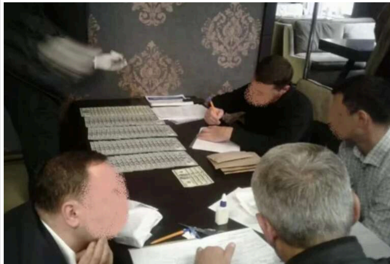
Депутат та колишній прокурор з Одещини отримали 10 і 8 років ув'язнення за хабарництво

Вищий антикорупційний суд визнав депутата Одеської обласної ради та колишнього керівника Ізмаїльської місцевої прокуратури Одеської області винними в одержанні неправомірної вигоди.