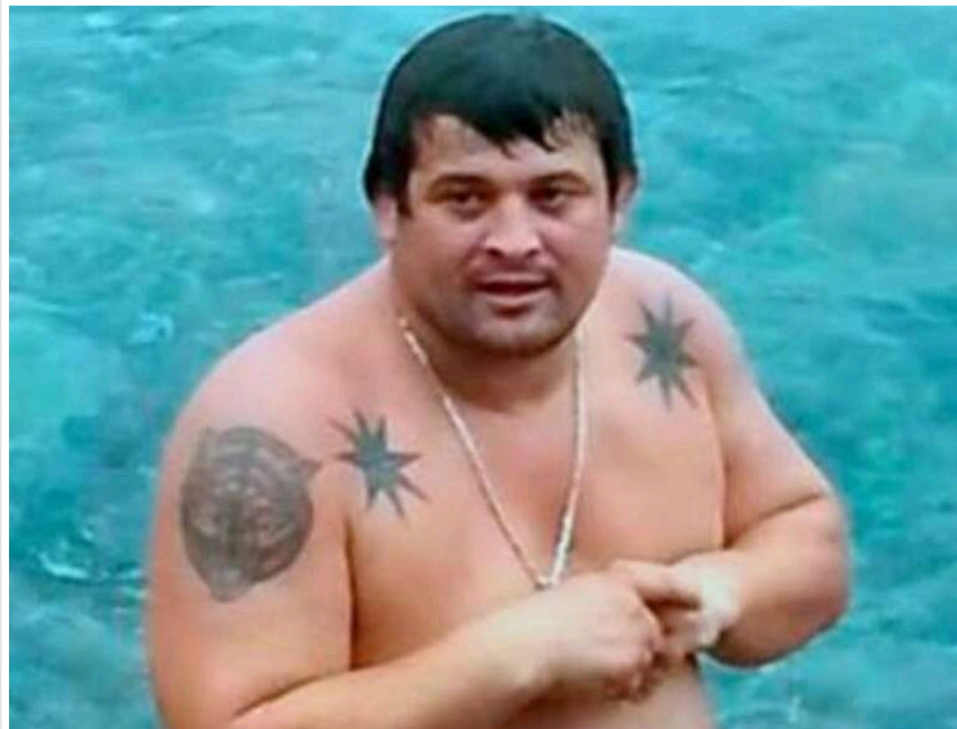
В Україні оголошено в розшук «зłodія в законі» Міндію Горадзе, причетного до здирництва в одеському СІЗО

Ватажка здирників Міндію Горадзе (відомого також як Лавасогли Батумський або Хромий) оголошено в розшук.