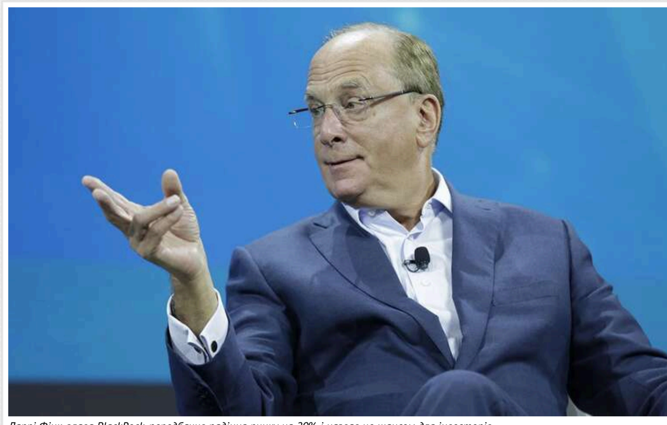
Ларрі Фінк, глава BlackRock, передбачив падіння ринку на 20% і назвав це шансом для інвесторів

Глава найбільшої інвестиційної компанії BlackRock Ларрі Фінк заявив, що не виключає можливості падіння світових ринків ще на 20%.