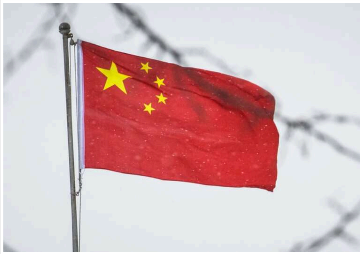
Тарифи на китайські товари можуть досягти 104%, - Білий дім

Білий дім попередив, що у разі введення нових тарифів на китайські товари їхня ставка може досягати 104%.