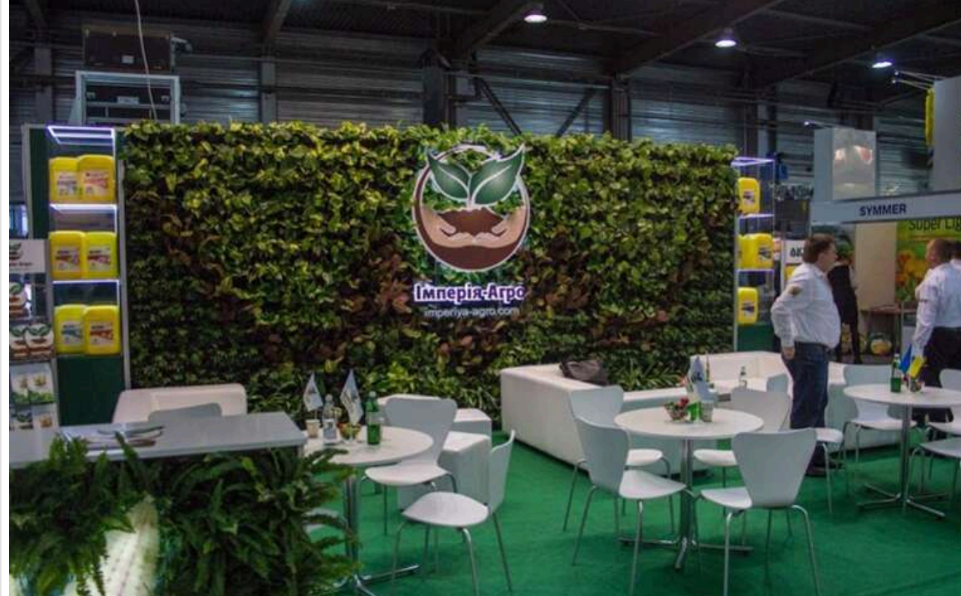
Банкрутство «Імперія-Агро»: злочинна змова Реверука та Литвиненка проти добросовісних кредиторів

У березні 2019 року широкого розголосу набула новина про порушення справи про банкрутство ТОВ «Імперія-Агро».