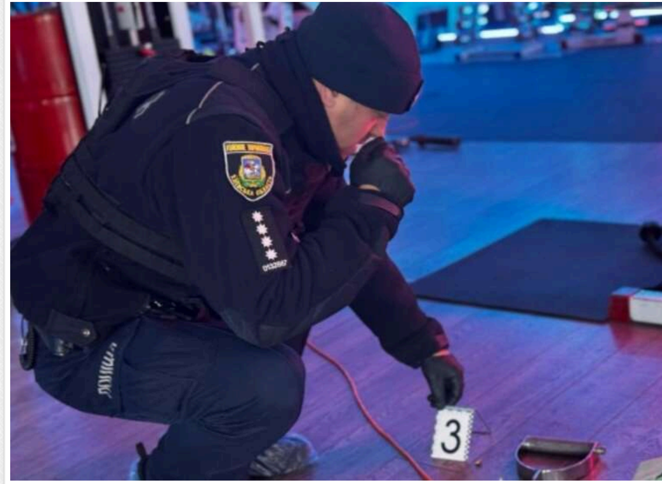
Перестрілка в ТРЦ у Білій Церкві: поранено громадянина РФ

В одному зі спортивних клубів торговельно-розважального центру в Білій Церкві 18 березня 2025 року сталася перестрілка. Унаслідок інциденту було поранено громадянина Російської Федерації чеченського походження.