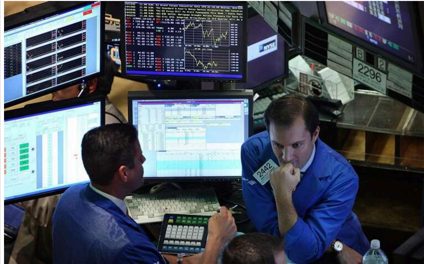
В Китає назвали пошлины США "издевательством": в МИД призвали другие страны продолжать консультации

Линь Цзянь, представник Міністерства закордонних справ Китаю, заявив, що загрози та тиск є невідповідними способами взаємодії з Китаєм, назвавши рішення президента США Дональда Трампа ввезти "відповідні мита" насмішкою, повідомляє Reuters.