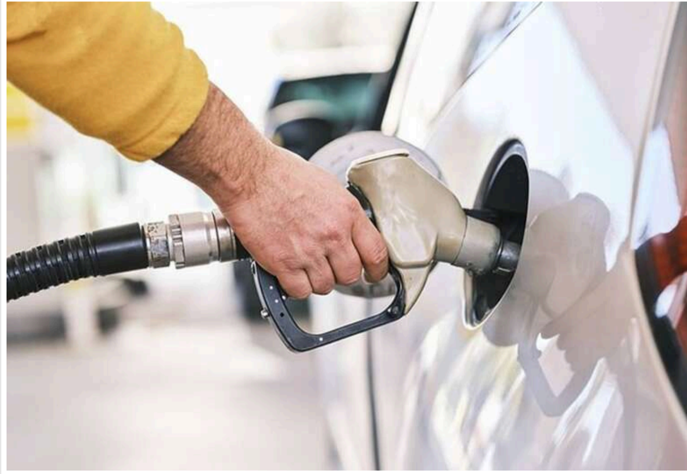
На тлі істотного зниження цін на нафту: В Україні прогнозують здешевлення палива

Упродовж місяця пальне на АЗС може подешевшати на 3 гривні за літр.