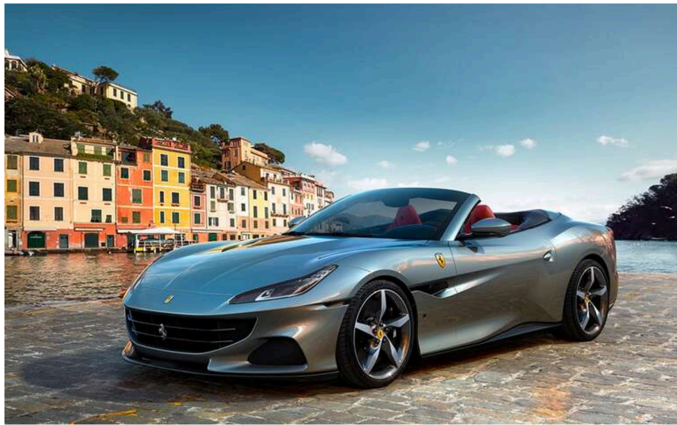
Придбав Ferrari: НАЗК виявило недостовірні дані на 25,7 мільйона гривень у декларації топчиновника Міноборони Валентина Слободянюка

Очільник комісії з припинення діяльності Центрального матеріального складу головного квартирно-експлуатаційного управління Міноборони Валентин Слободянюк (Штика) задекларував недостовірні дані на суму 25,717 млн грн, що може призвести до кримінальної відповідальності.