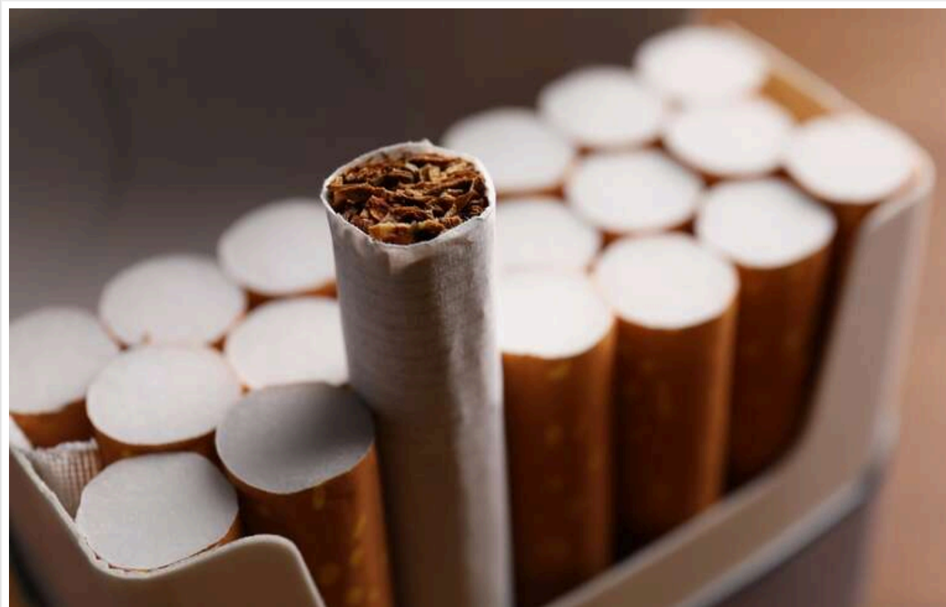
Прогноз втрат бюджету на 24 мільярди: Нелегальний тютюновий ринок повертає свої позиції