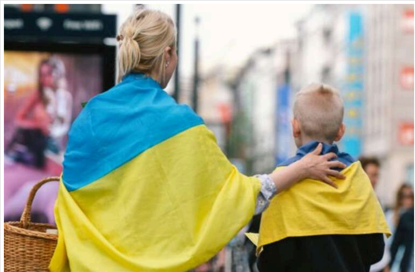
В ЄС немає чіткого плану: Мільйони українських біженців можуть втратити свій правовий статус після припинення вогню з Росією

Мільйони українських біженців у ЄС можуть зіштовхнутися із загрозою втрати свого правового статусу, оскільки не існує чіткого плану, що дозволяє їм залишитися після припинення вогню з Росією.