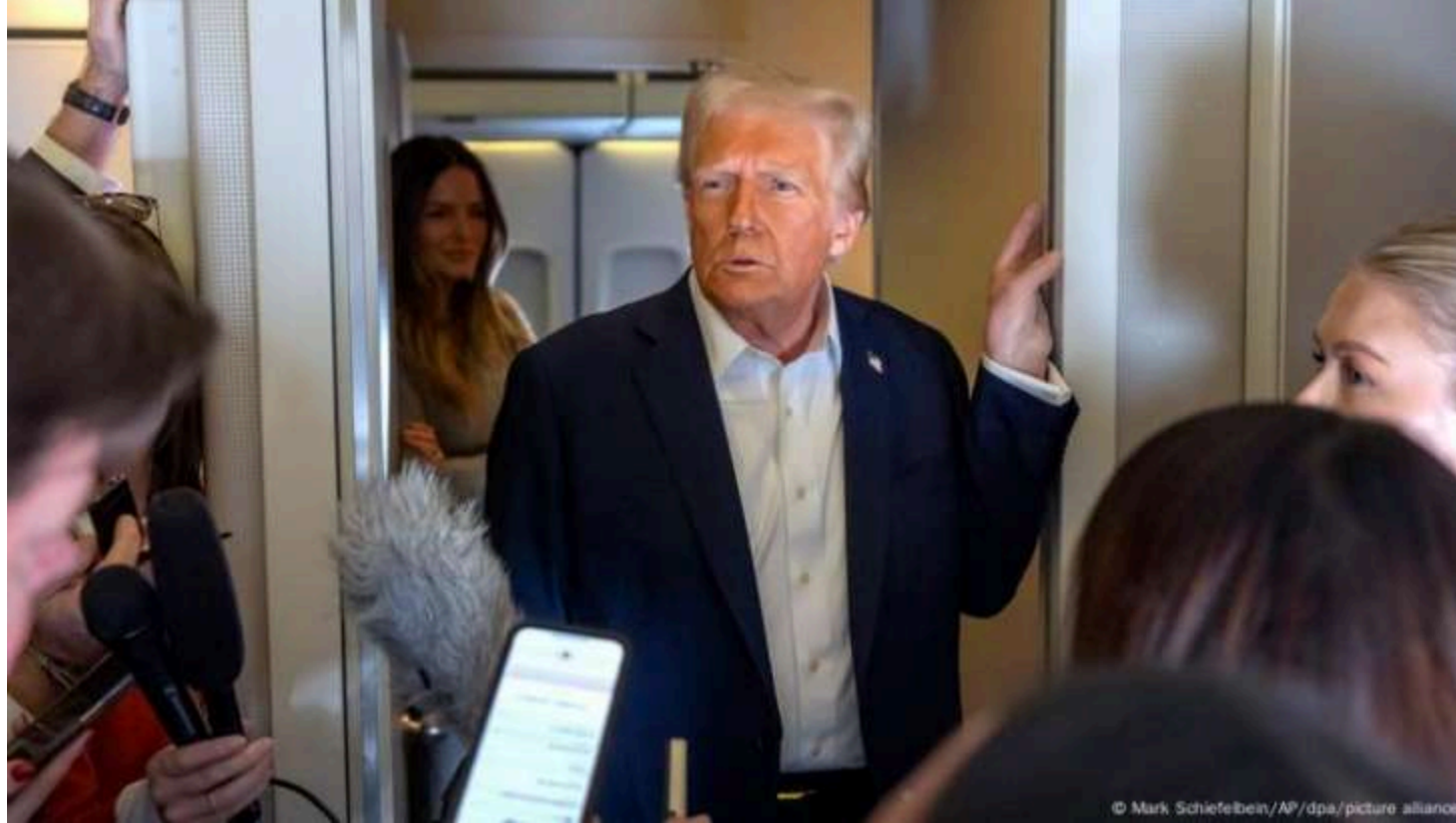
Фото: Дональд Трамп/huffpost.com

Президент США Дональд Трамп заявив, що не проти, якщо Україна та Росія самостійно домовляться про завершення війни. Водночас він стверджує, що саме його адміністрація підвела сторони до нинішнього етапу можливих переговорів. Про це Трамп сказав журналістам на борту літака Air Force One.