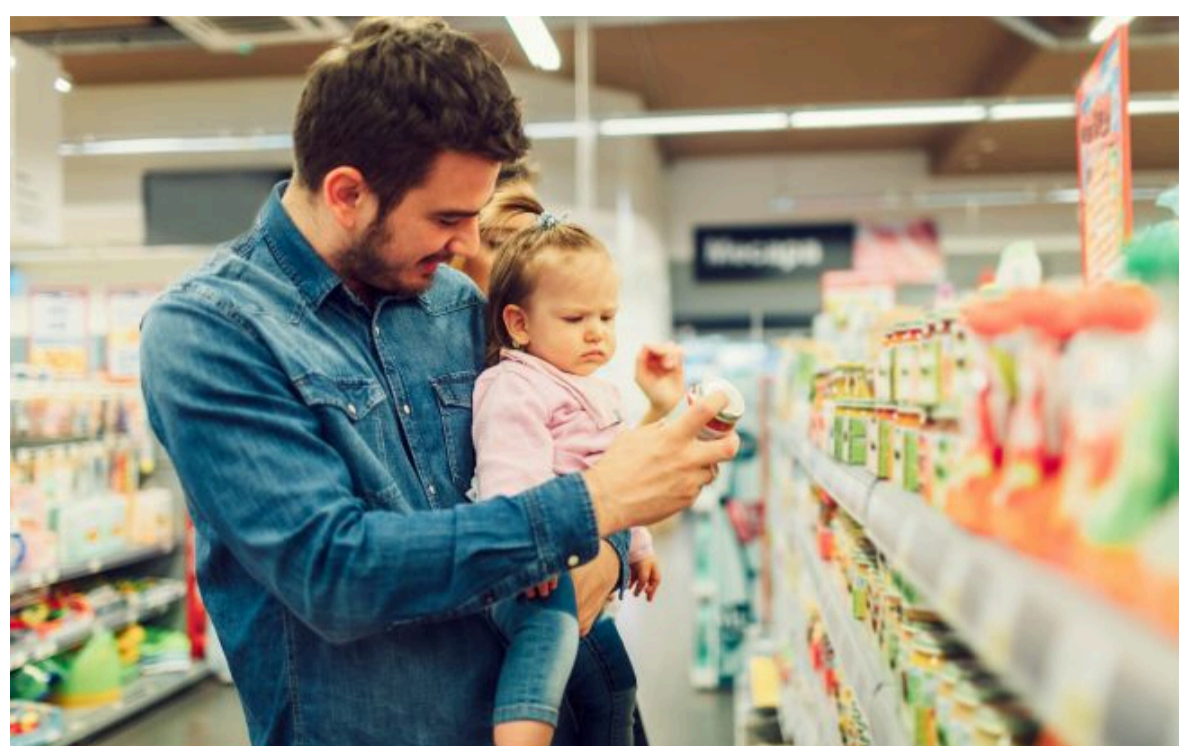
Фото: Що має бути вказано на пакуванні дитячого харчування?